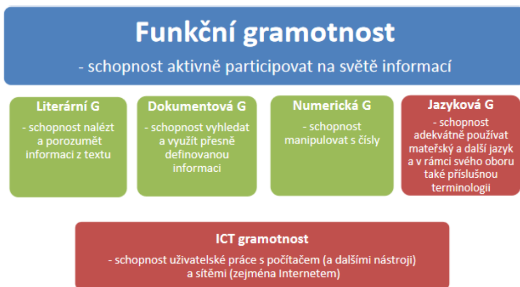
Obrázek 1: Model funkční gramotnosti obohacení o ICT gramotnost 4

Obrázky se číslují jednotně od začátku do konce práce. Titulek se umísťuje vždy pod obrázek. Obrázek je zároveň uveden v úvodní části práce v Seznamu ilustrací a tabulek. Pro odkazování je v tomto konkrétním příkladu použita metoda průběžných poznámek.